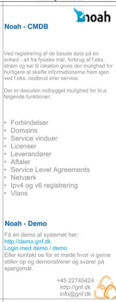
Panel - 3 Indvendig midterside